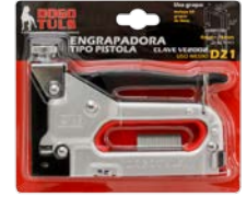
EMPAQUE (MIN: 4 PZAS)